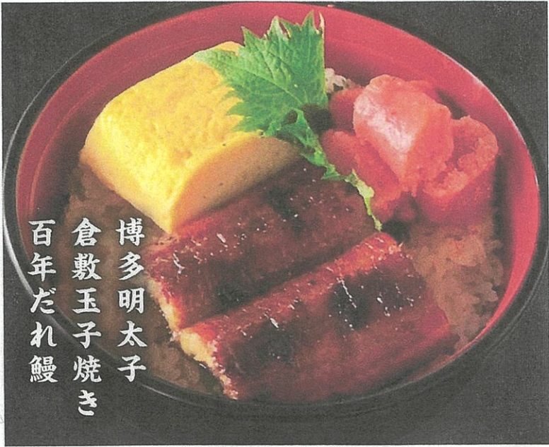
博多明太子 倉敷玉子焼き 百年だれ鰻